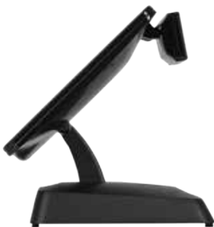
Dandy afficheur client