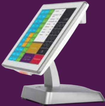
Indigo afficheur client