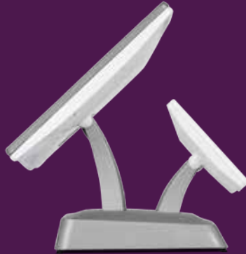
Indigo double écran